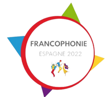
Table ronde dans laquelle les participants pourront débattre sur les sujets d'actualité sociale comme l'esclavage, le patriarcat et les droits humains abordés dans l'oeuvre de Tintin et qui prennent un nouveau visage aujourd'hui au 21ème siècle. Activité présentée par France Madrid

Tintin au 21ème siècle : Esclavage, patriarcat, exploitation et actualité sociale.